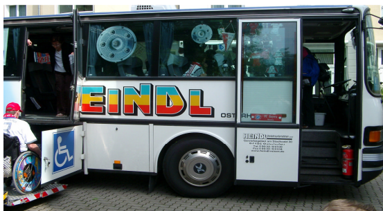
Meister-Deko muss sein: >> MIR SAN MIR <<