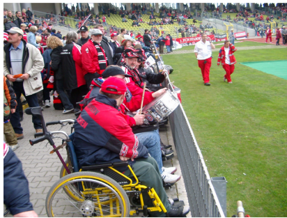
Easy-Credit-Stadion: Trommel dabei